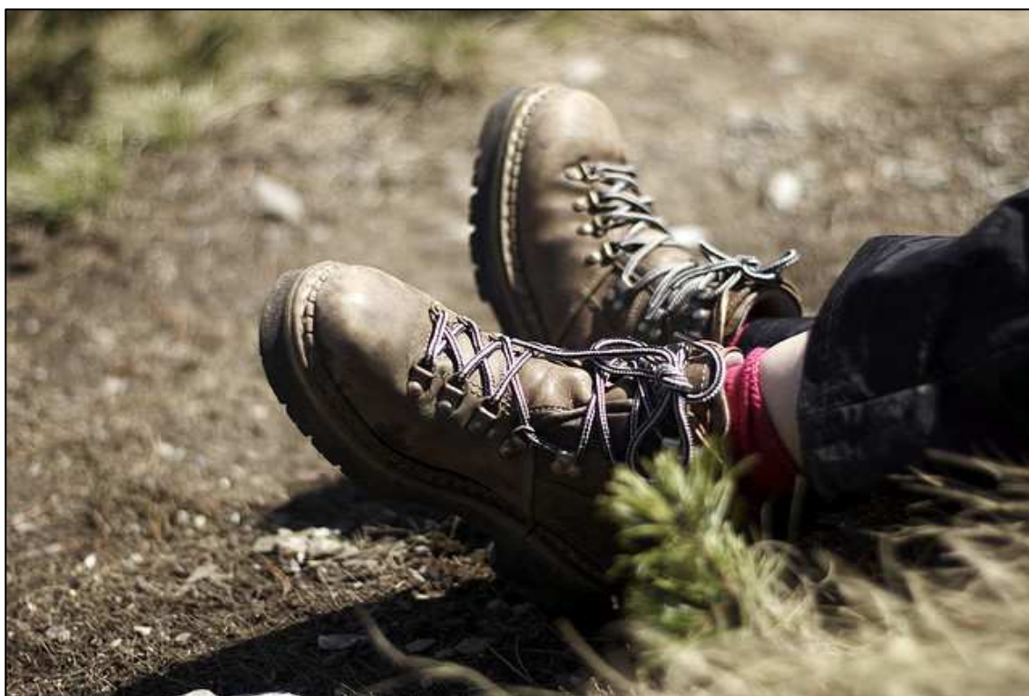
Petite pause relaxation ou gros mal de pied ?

Commencez par vous demander quelle est l'utilisation principale que vous allez en faire. Soyez réaliste, n'achetez pas une paire de chaussures qui pourrait aussi vous servir pour réaliser le sommet de vos rêves – vous aurez toujours l'occasion d'acheter cette paire plus tard. Votre choix dépend principalement des conditions et de la manière dont vous pratiquez la randonnée. L'idéal est d'avoir une paire pour chaque utilisation mais cela n'est souvent pas possible. Pour vous aider, ci-dessous sont détaillés les principaux types de chaussures en fonction de leur utilisation.