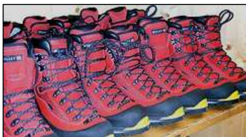
Chaussures de haute montagne

Les chaussures d'alpinisme regroupent un grand nombre de différents modèles de chaussures variant selon les conditions d'utilisation. En effet, on n'utilise pas les mêmes chaussures pour grimper un sommet de 8000 mètres et marcher sur un glacier en été dans les Alpes. Mais, nous ne rentrerons pas dans ces spécificités.