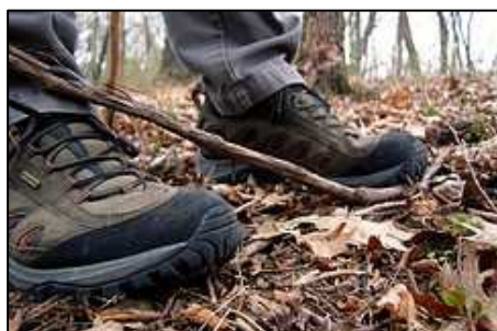
Chaussures de balade

La plupart des gens utilisent des chaussures de sport quand ils partent en balade mais ce n'est pas idéal. Elles sont toujours plus adaptées que des chaussures de ville mais manquent de maintien 1 et d'adhérence 2 en dehors du bitume.