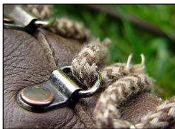
Les détails ont leur importance