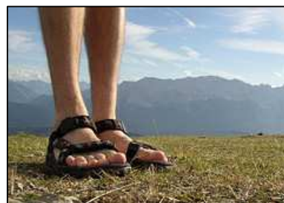
Sandales de marche

Elles peuvent être utilisées quand il fait chaud sur des chemins très faciles et plats. Elles sont aussi pratiques dans l'eau (marécages, rivières...) et le sable (désert, bord de mer,...). Par ailleurs, elles peuvent servir aux personnes qui ne souhaitent pas garder leur paire de