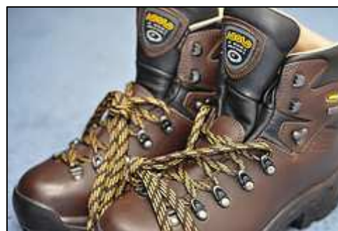
Chaussures de trek en cuir

Elles ont une tige haute, parfois légèrement plus haute que pour les chaussures de randonnée. Elles sont très souvent en cuir, imperméables et assez rigides. Elles offrent une meilleure protection (pare-pierres et renforts latéraux), un meilleur maintien et un meilleur confort que les chaussures de randonnée.