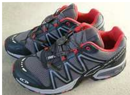
Chaussures de trail

Ce type de chaussures a été développé à la base pour les trails qui sont de longues courses sur des terrains difficiles avec beaucoup de dénivelé et les raids qui sont des courses comprenant plusieurs activités (vtt, kayak, course à pied...).