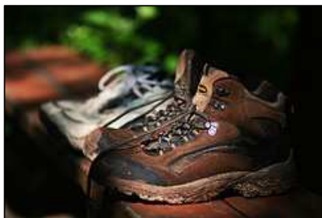
Chaussures de randonnée au premier plan

Ce sont probablement les chaussures de marche les plus vendues. Elles sont polyvalentes et ne représentent pas un énorme investissement.