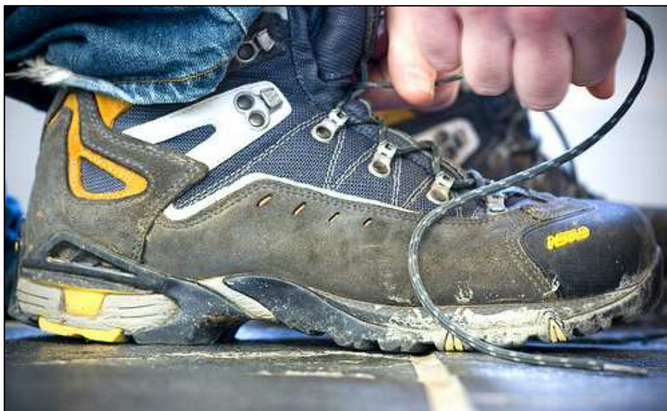
Bien essayer et tester des chaussures de marche est indispensable

Prenez le temps d'essayer plusieurs modèles pour trouver la largeur qui vous convient – celle pour laquelle votre pied ne se sent pas à l'étroit et ne flotte pas non plus. Pour faciliter votre choix, certains modèles offrent plusieurs largeurs différentes pour une même pointure.